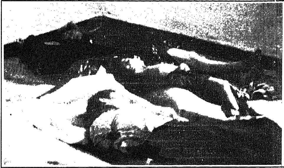
من ضحايا الإرهاب الأصولي

● هاجم أصوليون باصاً مدرسياً شرق الجزائر وقتلوا ثلاثة أشخاص وأصابوا سبعة عشر طالباً بجراح (الديار ٢٠/٥/٩٥).